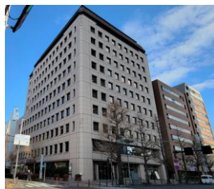
関内新井ビル(外観)

工事は県内の脱炭素化を推進する「神奈川県中小企業 省エネルギー設備導入補助金」を利用して2024年に改修を行いました。