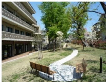
さくらえん 芝生の庭園