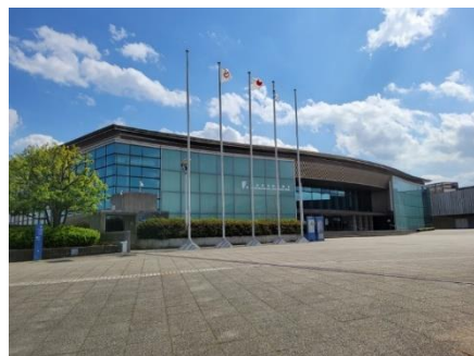
横浜国際プール外観

現在ではバスケットボールBリーグの「横浜ビー・コルセアーズ」のホームアリーナとして試合が開催されています。